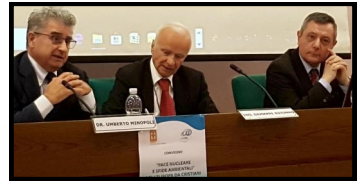
Foto - L'Associazione Italiana Nucleare al convegno “Pace nucleare e sfide ambientali” (Vaticano, 8 maggio 2018)