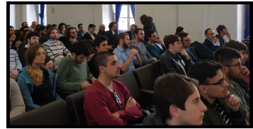
Foto - Seminario AIN-INYG/ Sapienza (Roma, 12.04.2019)