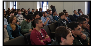
Foto - Seminario AIN-INYG/ Sapienza (Roma, 12.04.2019)